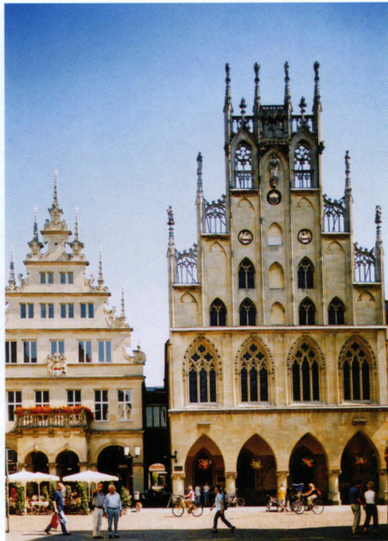
Service für Bürger und Rathaus: Expedition und Druck in Münster

In der Vergangenheit bestand der Aufgabenbereich der ehemaligen Postleitstelle darin, sich auf den Posteingang, auf Postbearbeitung und Postausgang zu beschränken. Jetzt hat sich daraus ein weit gefächertes Spektrum an speziellen Tätigkeiten unter Einsatz modernster Technologien entwickelt. Effizientes Arbeiten ist das Motto, das heute auch im öffentlichen Dienst von größter Wichtigkeit ist. Dabei haben die Bürgerinnen und Bürger zu Recht den Anspruch, dass mit möglichst geringem Personalaufwand viel in wenig Zeit produziert wird. So versteht sich Expedition & Druck als konsequenter Dienstleistungsbereich hauptsächlich für die Bürger von Münster, aber auch für sämtliche städtische Ämter und Einrichtungen.